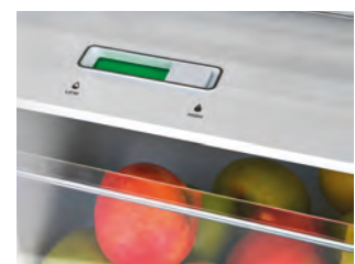
Regler zur Feuchtigkeitskontrolle